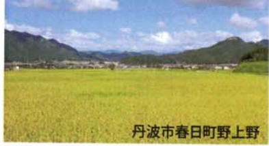
丹波市春日町野上野