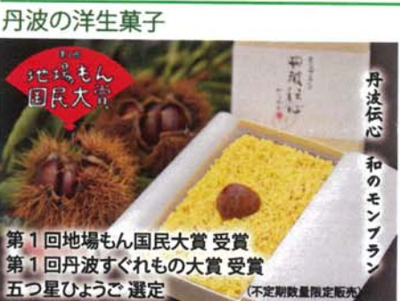
丹波の洋生菓子 第1回地場もん国民大賞受賞 第1回丹波すぐれもの大賞受賞 五つ星ひょうご選定 (不定期数量限定販売)