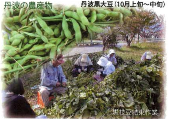
丹波の農産物 丹波黒大豆(10月上旬～中旬) 黒枝豆結実作業