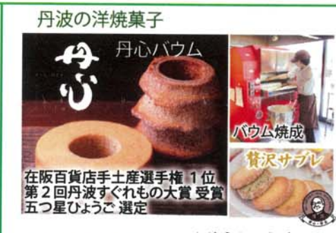
丹波の洋焼菓子 丹心パウム 在阪百貨店手土産選手権 1位 第2回丹波すぐれもの大賞受賞 五つ星ひょうご選定 バウム焼成 贅沢サブレ