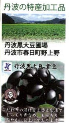
丹波の特産加工品 丹波黒大豆圃場 丹波市春日町野上野 丹波黒大豆煮豆 こだわりの丹波黒大豆を製造してじっくり煮詰め、もっちり艶やかに仕上げております