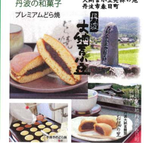
丹波の和菓子 プレミアムどら焼 大納言小豆発祥の地 丹波市春日町 お福の里 手焼きのどら焼