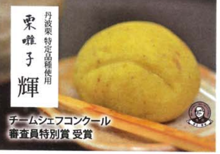
丹波栗特定品種使用 栗 輝 チームシェフコンクール 審査員特別賞受賞