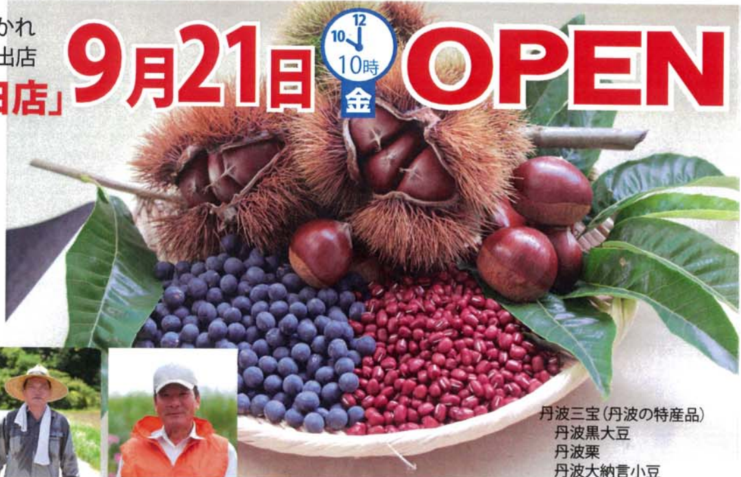
丹波三宝(丹波の特産品) 丹波黒大豆 丹波栗 丹波大納言小豆

兵庫県丹波市春日町(春日局 生誕の地)より丹波の一次 産品と特産加工品、和洋菓子を 製造現場より直送します。 丹心(まごころ)のせて・・・