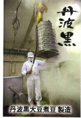
丹波黒大豆煮豆 製造