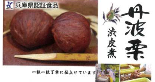
兵庫県認証食品 丹波栗 渋皮煮

風丹土波 TAMBAFU-DO The Sweets of Nature 東京春日店 株式会社やながわ