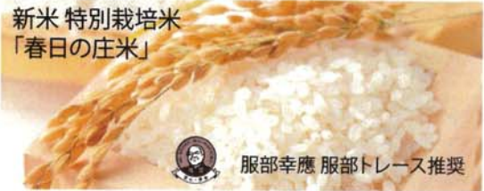
新米 特別栽培米 「春日の庄米」 服部幸應 服部トレース推奨