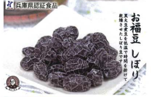
兵庫県認証食品 お福豆しぼり 黒大豆煮豆を低温で時間を掛けて乾燥させたしぼり豆です